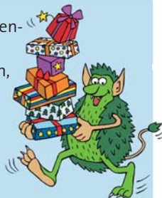
Illustrationen: Julia Beltz